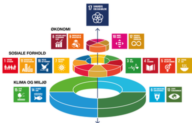
Figur: FNs 17 bærekraftsmål

Ifølge «Nasjonale forventninger til regional og kommunal planlegging» (av 14.05.2019) skal FNs bærekraftsmål ligge til grunn for all planlegging. Med utgangspunkt i disse forventningene vil Hamarøy kommune bruke den kommende prosessen med samfunnsdelen til å klarlegge nærmere hvilke av bærekraftsmålene som er viktigst for kommunen, og som følgelig bør få størst fokus i planarbeidet.