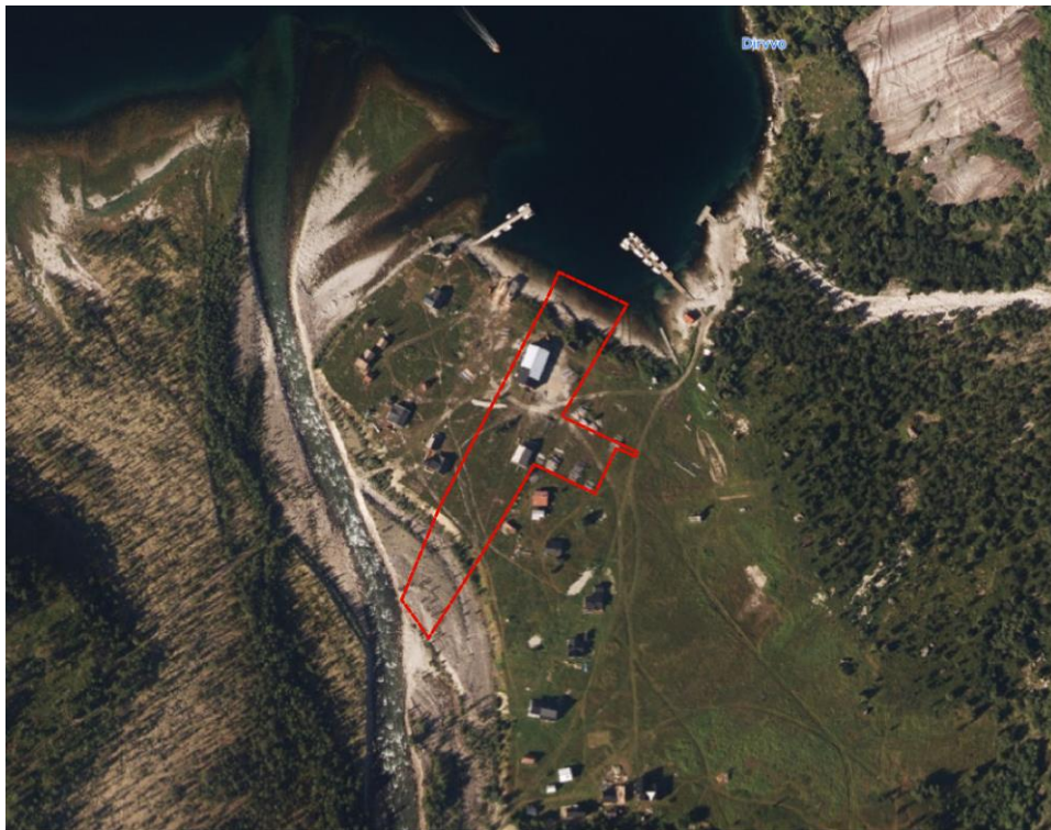
Figur 1 Oversiktskart