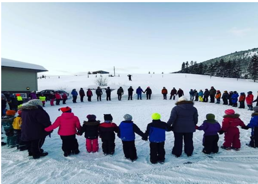
6. februar-feiring på Stall Eivik – Samisk kultur og språk