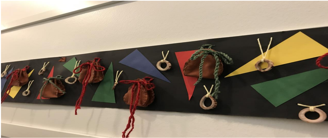
Duodje – prosjekt med Mattias Harr 5.-7.klasse