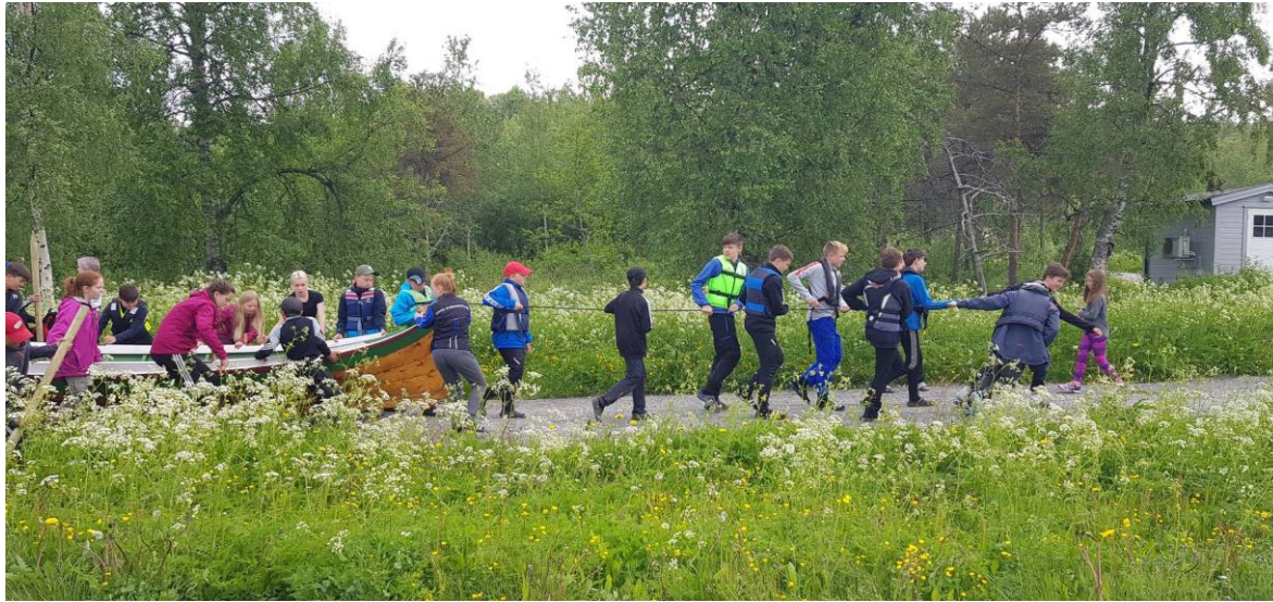
Gæsos-Draget på Drag – Kulturarv