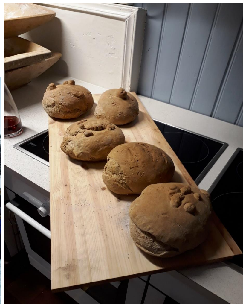
Bakedag på Handelsgården Breidablikk – Lokal kulturarv