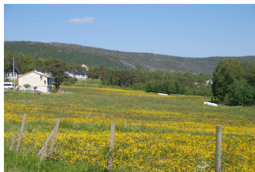
Natureng på Moen.

Siden starten av 1990-tallet har man opplevd at antallet bruksdelinger har stagnert på Helland . Dette har hatt sammenheng med at den demografiske utviklinga lokalt og i kommunen har redusert behovet for nyetablering av eiendommer. Etter siste bruksdeling i 1995 besto Helland vestre av i alt 157 bruksnummer.