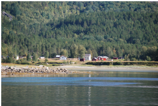
Mannfjorden i den nyere tid.